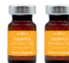
OZONYCA MANDELIC PEEL Peeling Mandelico