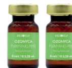
OZONYCA PURIFYING PEEL Peeling Purificante