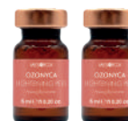
OZONYCA LIGHTENING PEEL Peeling Illuminante